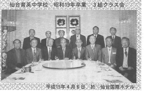
仙台育英中学校 昭和19年卒業 3組クラス会 平成15年4月6日 於 仙台国際ホテル