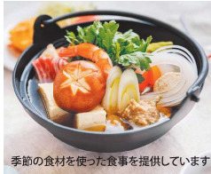
季節の食材を使った食事を提供しています