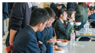
▲ローズホール【宮城野校舎】

宮城野校舎はローズホール、多賀城校舎はレオホール。それぞれの校舎に学食があります。ポリューム満点の安くて美味しいメニューが並びます。ランチは330円から! 両校舎共に仙台育英生のための購買部もあります。毎日のランチタイムを、楽しく!