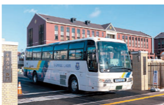
▲安心安全の専用シャトルバス