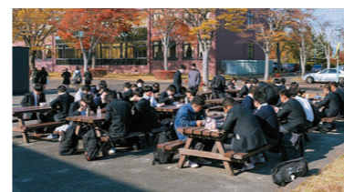
▲多賀城校舎での昼食風景