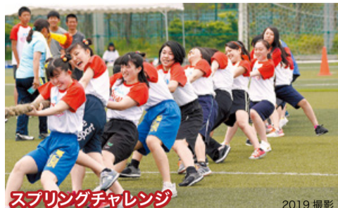
スプリングチャレンジ