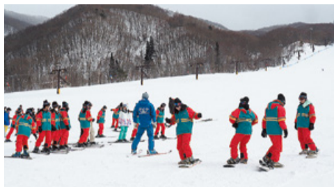
スキー・スノーボード教室