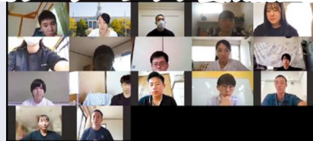
『ハーバード流 LEADERS BOOTCAMP』の様子▶

2022年度から、本校で新たな取り組み、ハーバード流リーダーシップ養成プログラムを導入します。このプログラムは、アメリカ合衆国ハーバード大学をはじめとした世界トップ学術機関で実践されている授業手法です。対象はAJ(英進進学コースの特